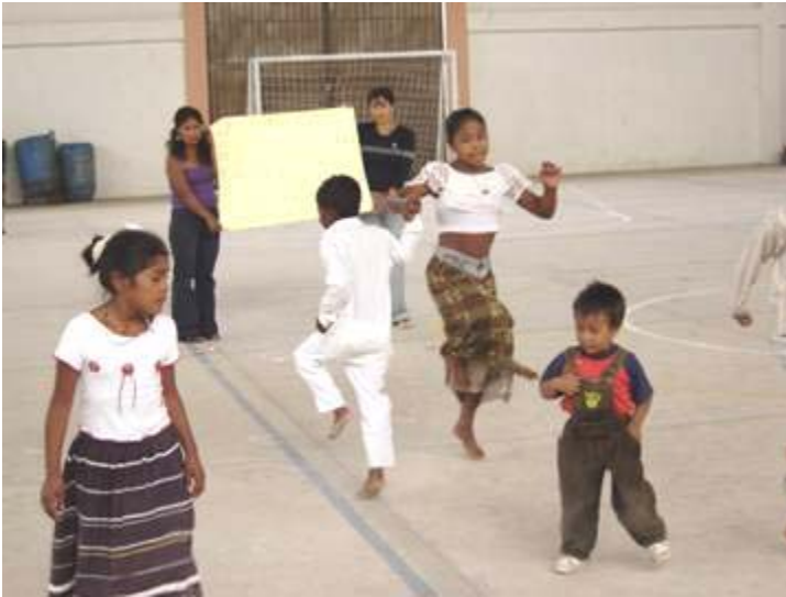
Danse lors de la fête de Noël