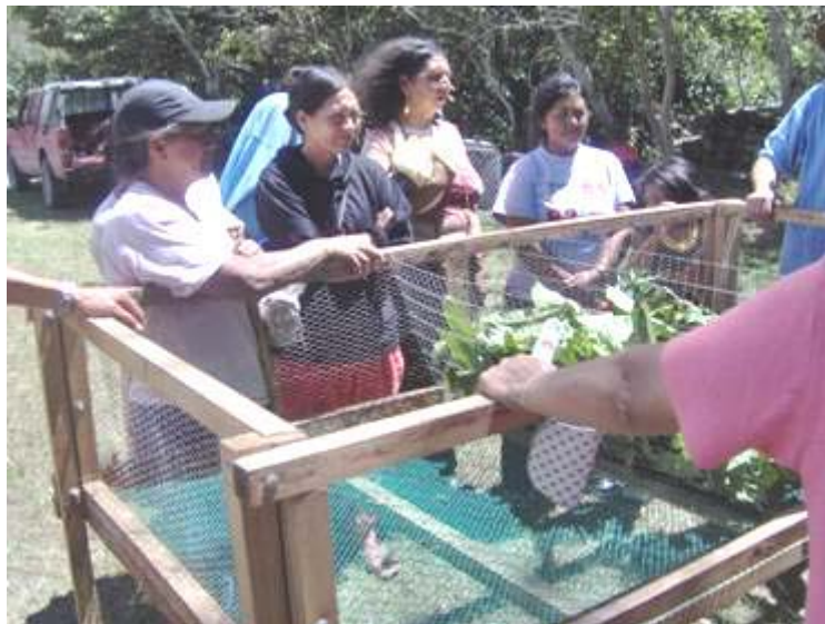
DES MÈRES DANS LE PROJET PRODUCTIF

En 2006, nous avons commencé la réalisation d'un projet productif pour les mères et les pères des enfants appartenant à la fondation. 40 Familles ont bénéficié l'année passé de la réalisation de leurs propres jardins potagers qui leur permettent d'utiliser et vendre les produits qui y cultivent, ou du projet de l'élevage des cochons d'Inde. Comme il est coutume dans cette zone rurale du Département de Nariño, ce rongeur est utilisé pour la consommation dans les foyers ou pour la vente. Ces projets seront amplifiés à d'autres familles en 2007.