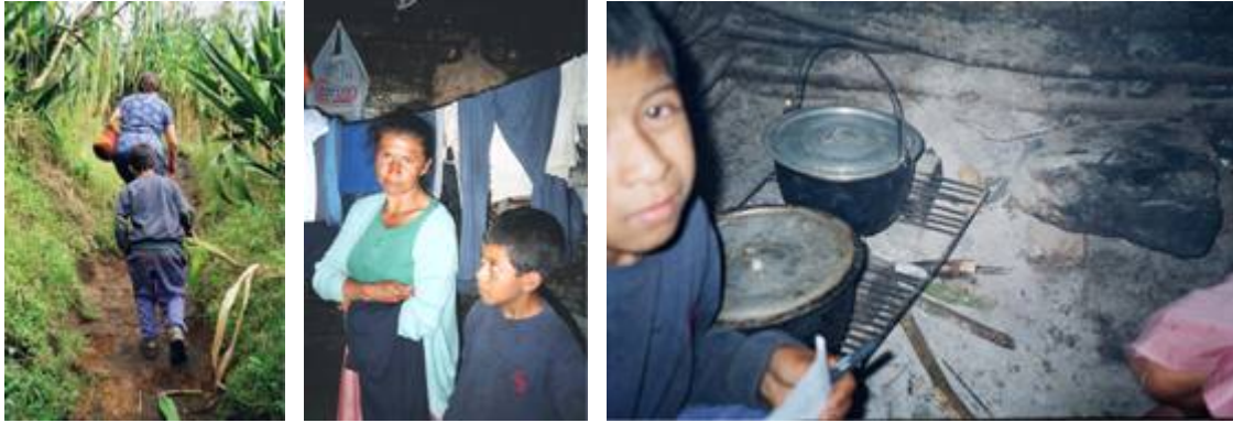
VISITE A UNE FAMILLE DE LA FUNDACION SOL Y LUNA COLOMBIA

En 2006, nous avons commencé la réalisation d'un projet productif pour les mères et les pères des enfants appartenant à la fondation. 40 Familles ont bénéficié l'année passé de la réalisation de leurs propres jardins potagers qui leur permettent d'utiliser et vendre les produits qui y cultivent, ou du projet de l'élevage des cochons d'Inde. Comme il est coutume dans cette zone rurale du Département de Nariño, ce rongeur est utilisé pour la consommation dans les foyers ou pour la vente. Ces projets seront amplifiés à d'autres familles en 2007.