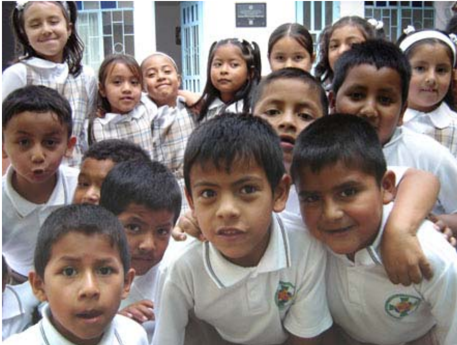
Elèves de la FUNDACIÓN SOL Y LUNA COLOMBIA

** Un dictionnaire pour l'école primaire et un autre pour l'école secondaire